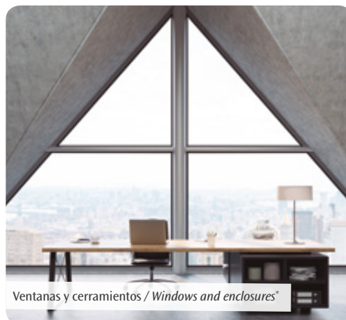
Ventanas y cerramientos / Windows and enclosures*