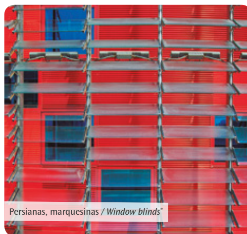
Persianas, marquesinas / Window blinds*

*Ejemplo de aplicación, no es imagen real de producto / Application reference, not real product image