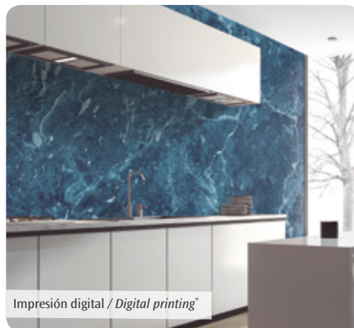
Impresión digital / Digital printing*